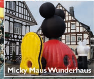
Micky Maus Wunderhaus